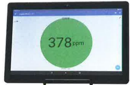
Androidタブレット（6ヶ月貸出）