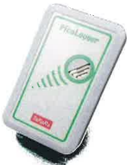
CO2センサー（6ヶ月貸出）